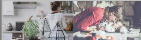
Plataforma de Empleo del Hogar de Sevilla

Los cuidados son imprescindibles para el sostenimiento de la vida