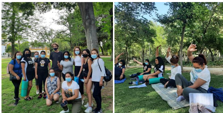
Taller de autocuidados en el parque de María Luisa.

Después de varios meses de restricciones por la pandemia, hemos buscado espacios al aire libre para proseguir los encuentros y formación.