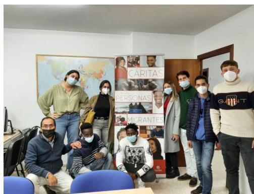
Visita a una casa de acogida.