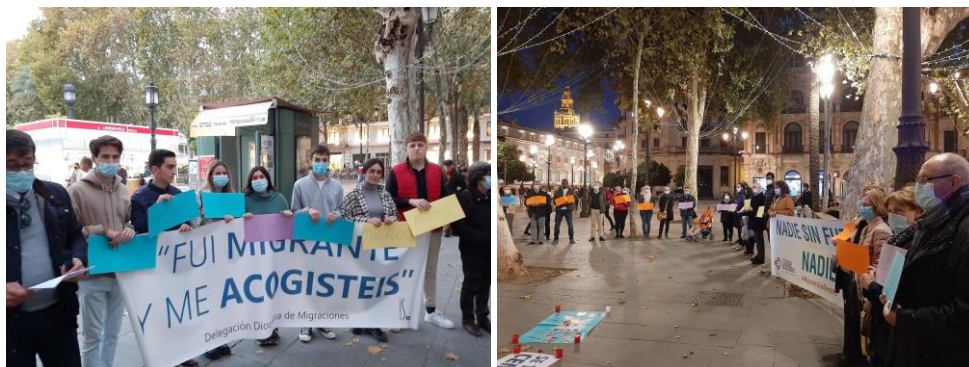
Participación en el Círculo de Silencio Espacios de visibilización del sufrimiento de las personas migrantes en el estrecho y en los CIE.

Además de los jóvenes en aprendizaje y servicio contamos 11 estudiantes en prácticas, que colaboraron en periodos entre los dos y los nueve meses. Como es habitual, las personas en prácticas se insertan en las líneas de Ciudadanía y Mujer migrante. Así, en Ciudadanía apoyan en la asesoría jurídica y la presencia semanal en la visita a los CIE de Algeciras y Tarifa, así como en el apoyo a espacios interculturales de participación. En la línea de Mujer apoyan el acompañamiento, información y acogida de mujeres de origen migrante y aportan charlas temáticas en los espacios formativos.